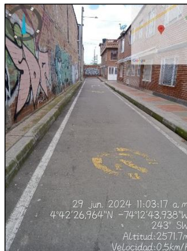
Ilustración 2. Evidencias recorrido